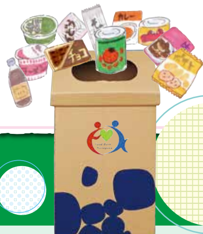
専用回収ボックス

寄贈された食品は、フードバンクかながわで管理し、行政・社協の相談窓口、地域のフードバンク等を通じて食料を必要とする人や、子ども食堂・母子支援施設などに届けます。フードバンクかながわは、神奈川県が生協・労働団体・JA・市民団体12団体により設立され食料支援活動を行っています。